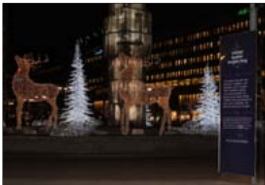
Bredvid de lysande renarna och granarna finns en skylt där de sponsrande företagen önskar stockholmarna en god jul.